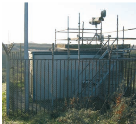
Boven: Corus heeft al jaren twee meetlocaties

Op het dak van de meetpost wordt door een aanzuigkop continu buitenlucht aangezogen. In het geval van een PM10-meting wordt de luchtstroom met stofdeeltjes < 10 µm doorgelaten. Door de luchtstroom te verwarmen tot 50 °C (standaard TEOM: Tapered Element Oscillating Microbalance) of deze via een droger (TEOM-FDMS) te leiden wordt het vocht verwijderd. Vervolgens worden deze kleine stofdeeltjes op een speciaal weeg ltertje verzameld. Dit ltertje (op een soort stemvork) trilt continue.