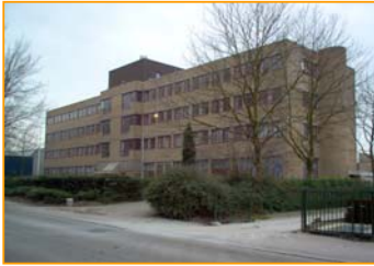
Een van de door Magielsen (2004) onderzochte cases: kantoorpand aan de Rotterdamseweg in Delft. Bouwjaar 1982; 5.150 m 2 VVO.

Dit pand staat sinds 2002 leeg. Voor de eigenaar betekent dit een jaarlijkse huurderiving van € 566.440,- (€ 95,- per m 2 VVO). Er worden wel kosten gemaakt, onder meer voor een anti-kraakgroep. Het pand heeft een aantal locatie- en gebouweigenschappen die gunstig zijn voor transformatie: